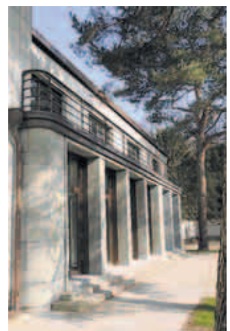
Geländer und Fensterfassungen wurden von einem Kupferschmied erneuert.