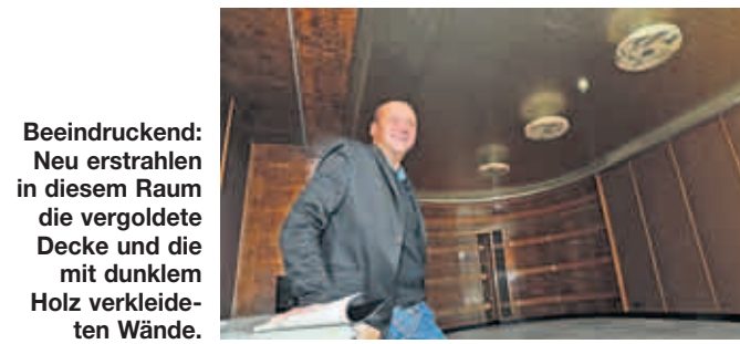
Beeindruckend: Neu erstrahlen in diesem Raum die vergoldete Decke und die mit dunklem Holz verkleideten Wände.