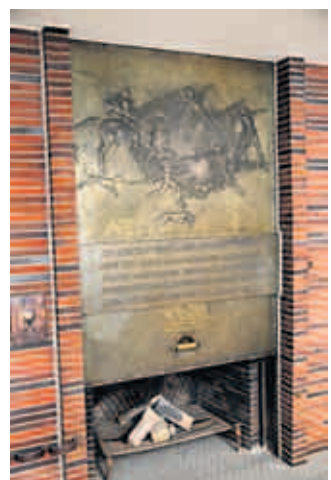
Die alte Bronzetafel verdeckt auf Wunsch den Kamin oder verschwindet in der Decke.